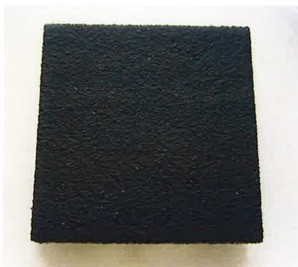
Foto 1: Untersuchungsmaterial AEROFLEX FIRO 6 mm dick, Farbe schwarz nach einer Inkubationszeit von 28 Tagen ohne sichtbaren Pilzbewuchs